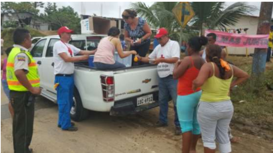
Trabajo lúdico con los niños en uno de los albergues.